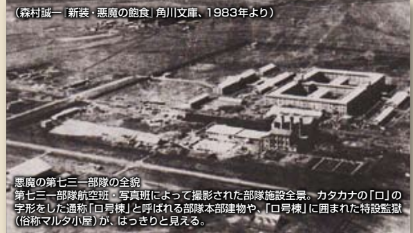
(森村誠一「新装・悪魔の飽食」角川文庫、1983年より)

悪魔の第七三一部隊の全貌 第七三一部隊航空班・写真班によって撮影された部隊施設全景。カタカナの「ロ」の字形をした通称「ロ号棟」と呼ばれる部隊本部建物や、「ロ号棟」に囲まれた特設監獄(俗称マルタ小屋)が、はっきりと見える。